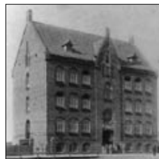
Foto de 1900

Estetiko ludas gravan rolon celante la estimon de spaco kaj materialoj. Kognicio, sensoj, emocioj kaj ankaŭ la naturo apartenas al la instrukoncepto. Per klaraj strukturoj la infanoj ricevu pozitivan rilaton kaj konfidon al la lernejo.