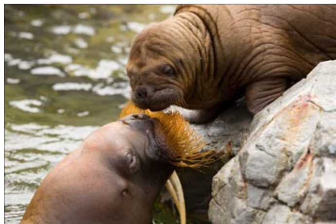
Rosmara patrino kun ido en Kamogava, Japanio