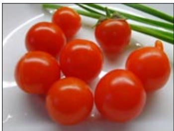
Balkonaj tomatoj

La ruzaj ĉinoj montras, ke eblas produkti pomojn sen abeloj: Tie multaj diligentaj manoj de homaj polenigistoj per penikoj anstataŭas la abelojn en pomo-kulturejoj, ĉar la aero en la ĉirkaŭaĵo estas tro venenigita, ke abeloj povus vivi tie.