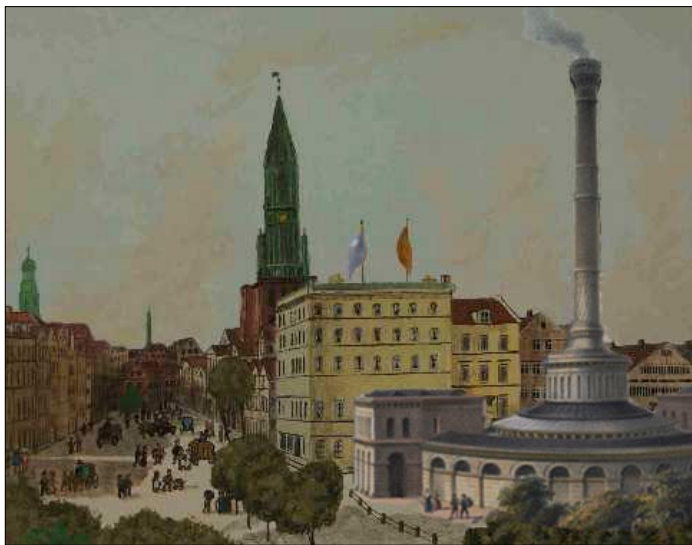
Lav- kaj bandomo de William Lindley , 1854

La kahelaj bildoj en la metrostacio memorigas pri la lav- kaj bandomo apud Steinstraße ĉe la iama Schweinemarkt . La konstruaĵo ne estis detruiita en la dua mondmilito, kiel la ĉirkaŭaĵo.