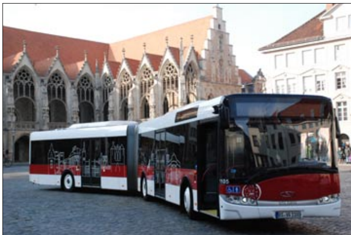
Artika buso en la urbocentro de Brunsvigo

En Hamburg ekzistas simila sistemo kiun oni testas en la aŭtomataj kontener-transportiloj sur la tereno de HHLA (Hamburga Havena kaj Loĝistika entrepreno).