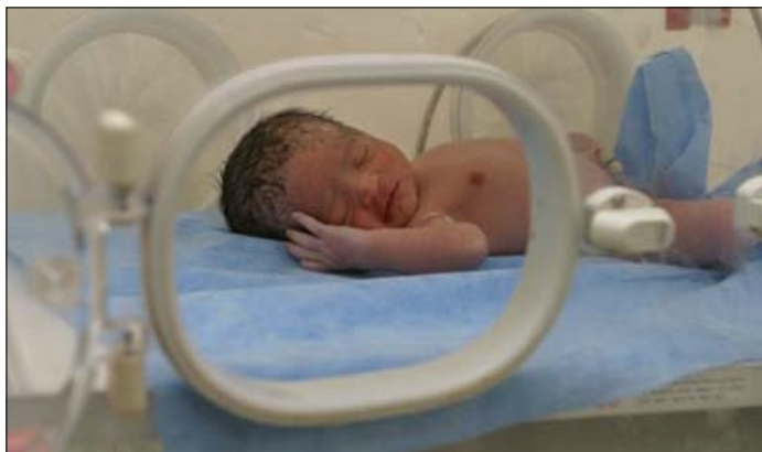
Bebo en kovilo