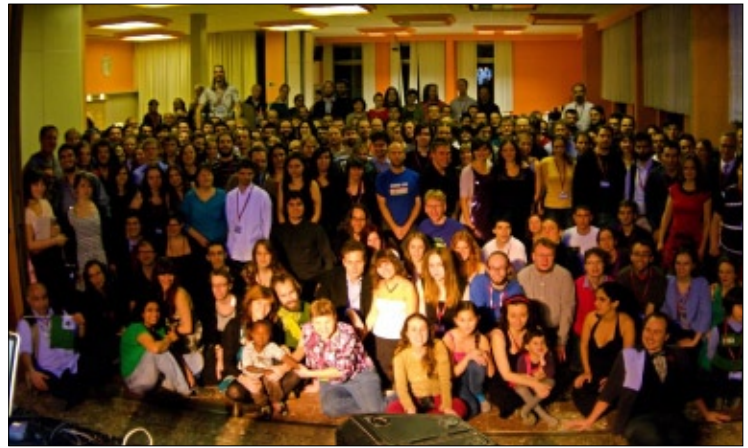
Tiom multaj partoprenantoj

La programo enhavis diversajn lingvo-kursojn, lernado de saltstilizado, kursoj pri masaĝo de manoj, teksaĵpentrado kaj renesancaj dancoj.