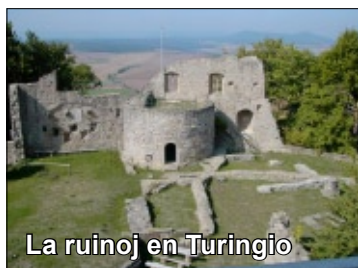
La ruinoj en Turingio