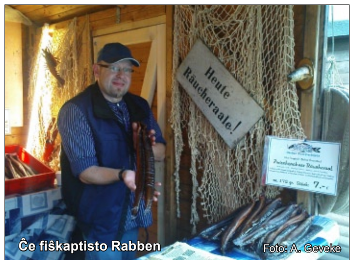
Ĉe fiŝkaptisto Rabben