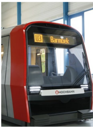
Metroaj trajnoj 1912 kaj 2012