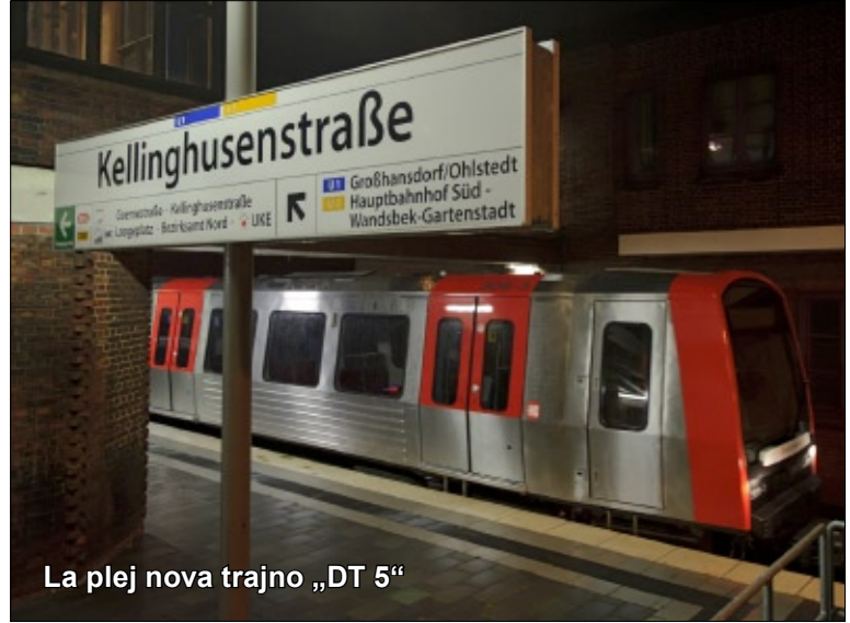
La plej nova trajno „DT 5“