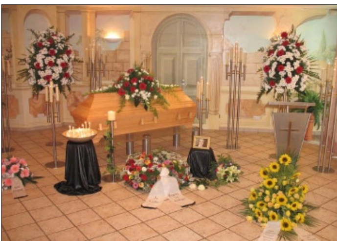
En la funebra halo

(SOS-Kinderdörfer estas internacie aganta asocio por ebligi al orfoj familian kunvivadon en tiel nomataj infan-vilaĝoj.