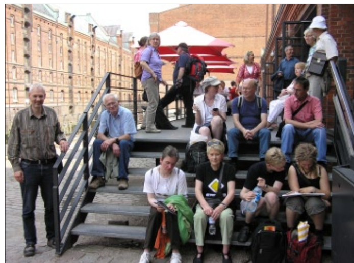
Antaŭ la havenurba informejo