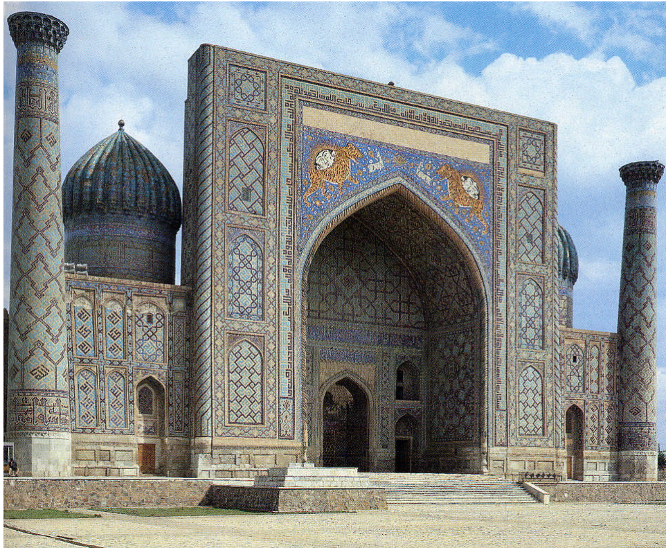
Samarkando: Portalo de maŭzoleo Ŝadi-Mul-Aka, unu el multaj valoraj konstruaĵoj

Bulteno de Hamburga Esperanto Societo r. a.