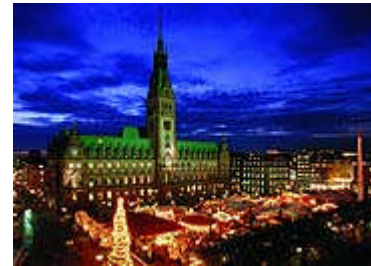
La urbodomo kaj kristnaska foiro en Hamburg