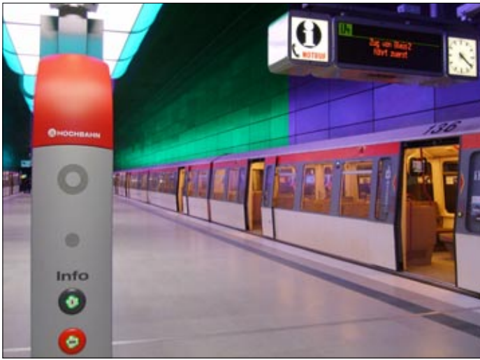
Fotomontaĵo montras la ŝanĝiĝantan lumon en la metrostacio Hafen-City-Universität; vere vidindas!