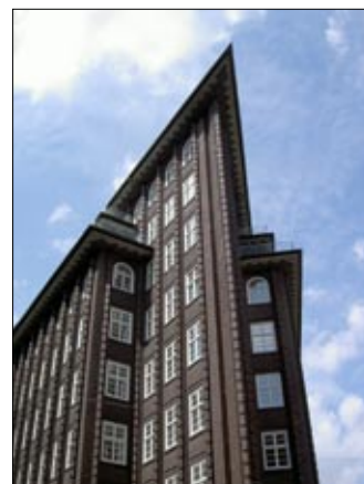
Kontoroj de la ŝip-entreprenoj (1910-1925)