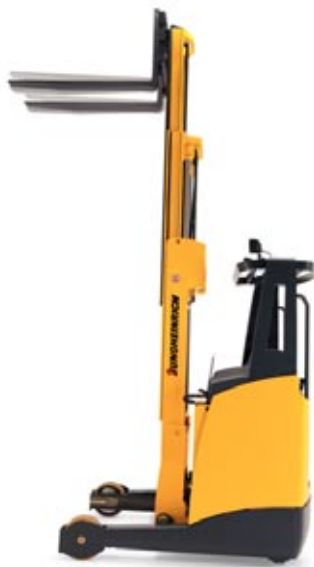
tipo ETV214

Ĉareloj estas produktataj de diversaj entreprenoj. La Hamburga produktanto Jungheinrich post Toyota kaj la KION -grupo ( Linde , Still ) estas la tria plej granda. La entrepreno per eksportoj al Ĉinio nun sukcesis plialtigi la akiritajn negocojn je ĉirkaŭ 17%, la gajno kreskis de 38,3 al 38,5 milionoj da eŭroj. Laŭ ekonomikaj fakuloj tio estas neatendite granda sukceso en la momente ĝenerale malbona situacio en la ekonomio.