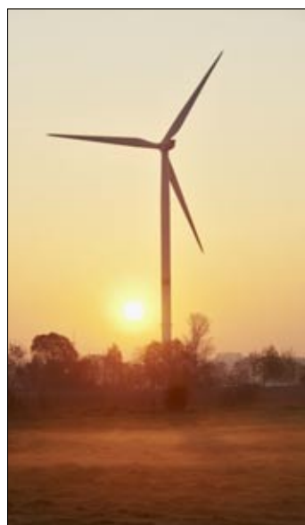
Nordex Gamma ventoturbino

En Hamburg pli ol 600 entreprenoj laboras pri ventoenergiaj instalaĵoj. La produktanto Nordex antaŭ kelkaj semajnoj akiris kontrakton por liverado de ventoenergiaj instalaĵoj en Sudafriko kun valoro de 80 milionoj da eŭroj. La vento-parko Red Cap Kouga kun 32 turbinoj jam estas la dua sukceso de Nordex en Sudafriko.