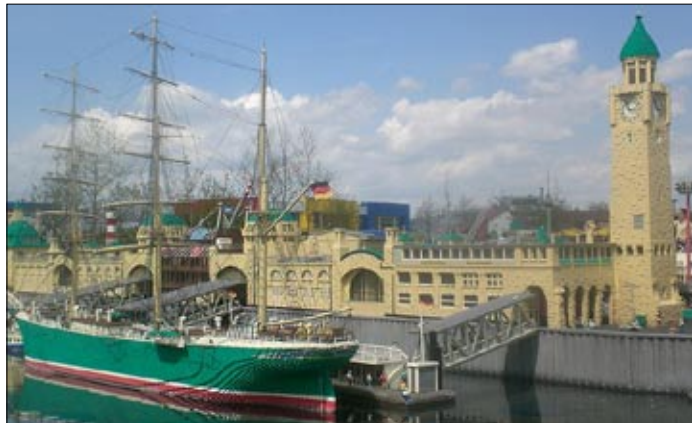
Rickmer Rickmers en Legoland

1787 senato kaj parlamento laŭ postuloj de la „Commerz Deputation“, antaŭulo de la nuna komerca ĉambro, instalas „havenpatrolon“: La origino de la hodiaŭa surakva polico, kiu kiel „havenpolico“ jam antaŭ la unua mondmilito disponis pri dekunu vapor- kaj motorbarkasoj.