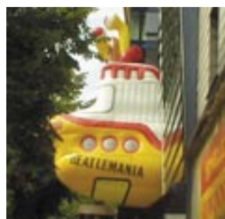
La flava submarŝipo super la enirejo

La vizitantoj travivu vojaĝon tra la mondo de la konataj muzikistoj. En distanco de nur 30 metroj de la Beatles-Placo oni trovas plian eblecon memori pri la fama grupo.