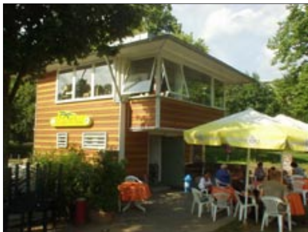
Kiam brilas suno, la teraso invitas al kunsidado

Nia Somera Festo en la gastejo Oase bedaŭrinde ne povis okazi sur la teraso, ĉar blovis malvarma vento. Do ni sidis supre apud la fenestroj kaj manĝis diversajn rostitajn specialaĵojn de kokidaĵo kaj porkaĵo kune kun aldonaj manĝaĵoj kaj salato. La etoso estis bona por la 13 ĉeestantoj, kiuj vigle babilis kaj estis kontentaj pri la elektita loko. Post la abunda vespermanĝo la ĉielo nigriĝis kaj anonciĝis fulmotondro kaj ni decidis iri hejmen antaŭ ol komencis pluvi – do ne okazis la fama noktmeza rondo .