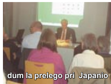
dum la prelego pri Japanio