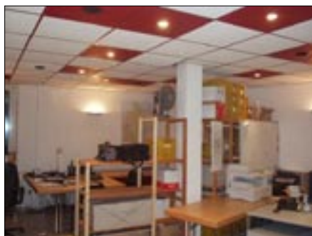
La granda salono en la suba etaĝo