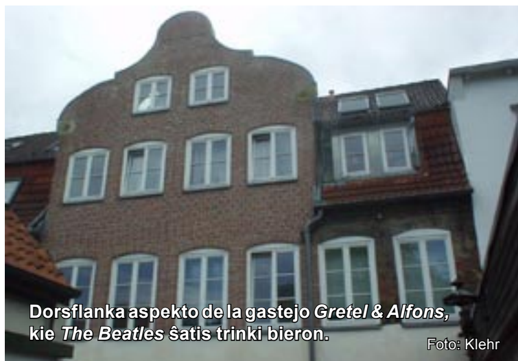
Dorsflanka aspekto de la gastejo Gretel & Alfons , kie The Beatles ŝatis trinki bieron.

Baroko: La preĝejo de S-ta Jozefo estis konstruita 1720-24 laŭ planoj de viena arĥitekto Melchior Tatz . Ĝi estas la plej malnova katolika preĝejo en nuna Hamburg. Kiam ĝi estis konstruita, la strato apartenis al la urbo Altona , kies reganto, la Duko de Holstinio , samtempe Reĝo de Danio , permesis tion, dum en Luterana Hamburg oni malpermesis katolikajn preĝejojn. La nomoj de du larĝa kaj mallarĝa stratoj Große Freiheit kaj Kleine Freiheit memorigas pri la Libereco , kiun donis tie la urbo Altona pri profesio kaj religio.