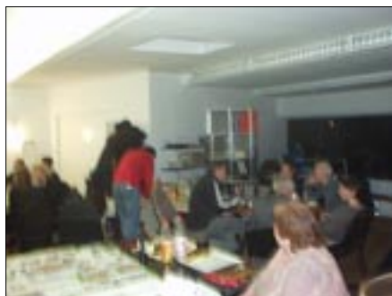
La salono en la supra etaĝo

Nia biblioteko nun troviĝas en malgranda ĉambro en la suba etaĝo. Ni planas starigi bretarojn por povi atingi ĉiun libron sen longa serĉado.