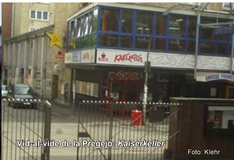
Vid-al-vido de la Preĝejo: Kaiserkeller