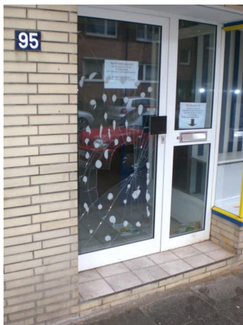
La detruita vitraĵo

Ni estis devigitaj provizore riparigi la vitraĵon je dimanĉo. Al nia luanto venis atestanto kiu diris ke li konas la homon kiu detruis la vitraĵon. La polico nun serĉas la koncernan viron sed ĝis nun ne