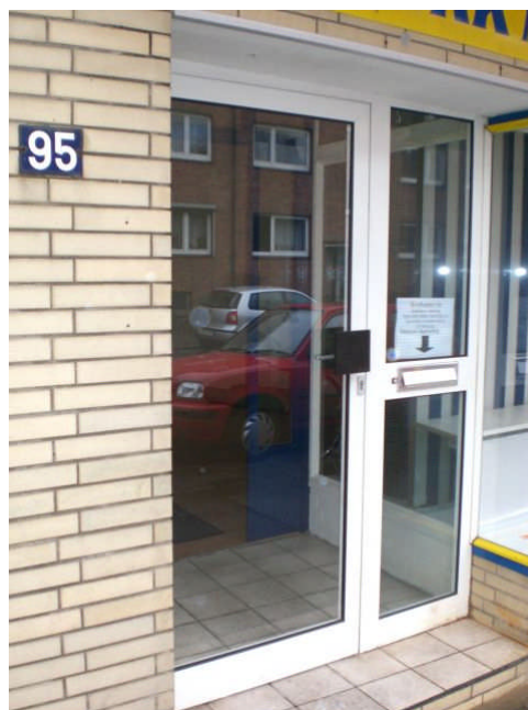
La riparita vitraĵo