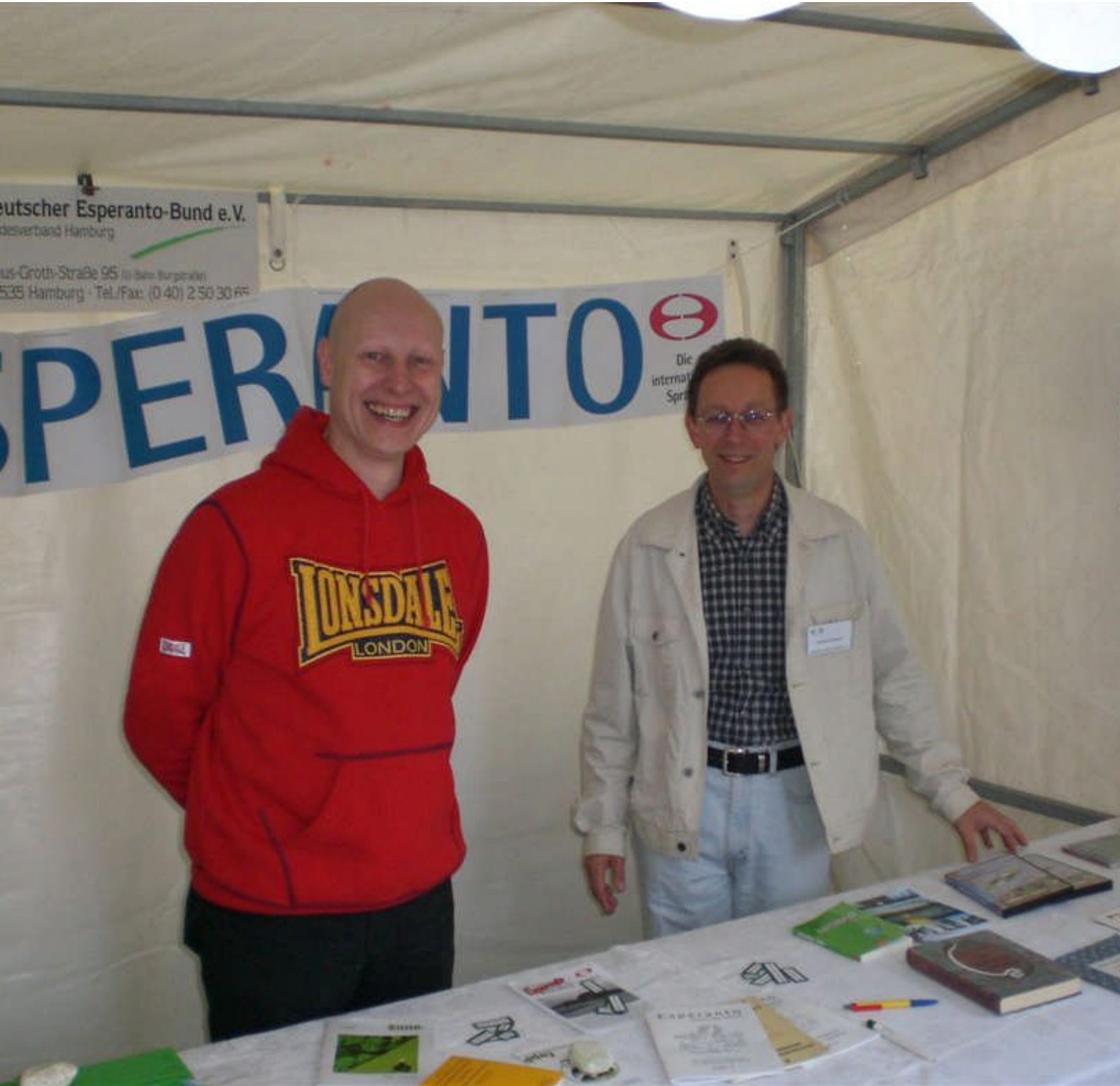
Re al Esperanto en Hamburg