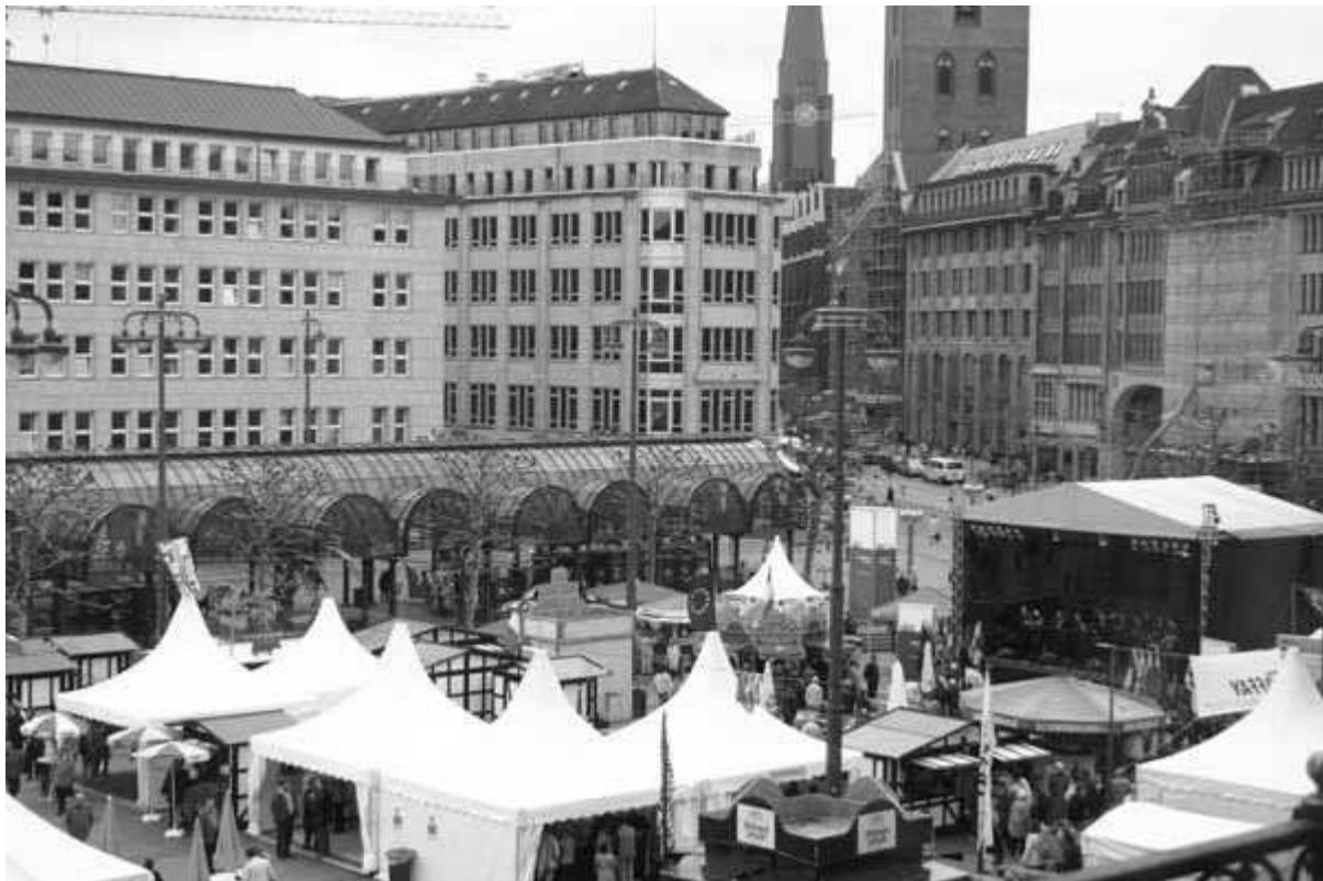
La Eŭropa Festo kun scenejo antaŭ la urbodomo.

Kun la moto "unuigita en multfaceteco" en Hamburg oni festis de la 23a de Aprilo ĝis la 2a de Majo la pligrandiĝon de EU. Ankaŭ Esperanto estis prezentita dum tri tagoj en tendo (Ni nur povas fari tion kiam niaj membroj havas tempon). Sed la atenton de la publiko ankaŭ kaptis Ralph Glomp per kantado kaj prezentado de Esperanto dum du tagoj.