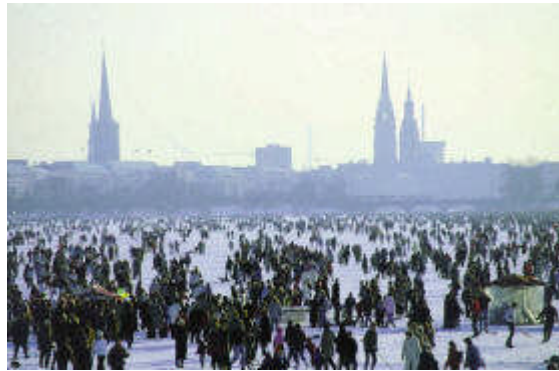
Vintro en Hamburg: Promenado sur glaciĝinta Alster-Lago

Bulteno de Hamburga Esperanto Societo r. a.