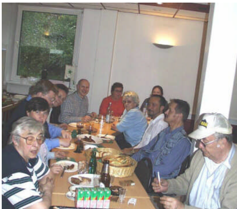
En la klubejo dum somera festo

Por tiuj kiuj spontane venas aŭ forgesas kunporti donacon - ne zorgu, Sankta Nikolao jam lasis kelkajn donacojn en la klubejo, por ke ĉiuj revenu hejmen kun donaco.