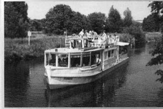
MS „Freiherr von Münchhausen II“