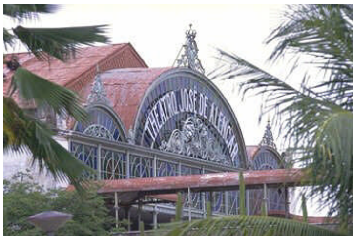
Fotoj: Shiplevatoro kaj shipeto sur Finow-kanalo, Foirejo kaj kastelo de Husum, Impresoj el Fortaleza

87-a Universala Kongreso de Esperanto en Fortaleza / Brazilo Germana Esperanto-Kongreso en Husum (17.-20.5.2002) 1-a Finow-Kanal-Kunveno che Eberswalde (22.-23.6.2002).