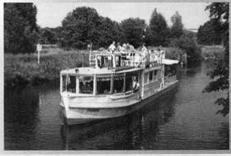
MS „Freiherr von Münchhausen II“