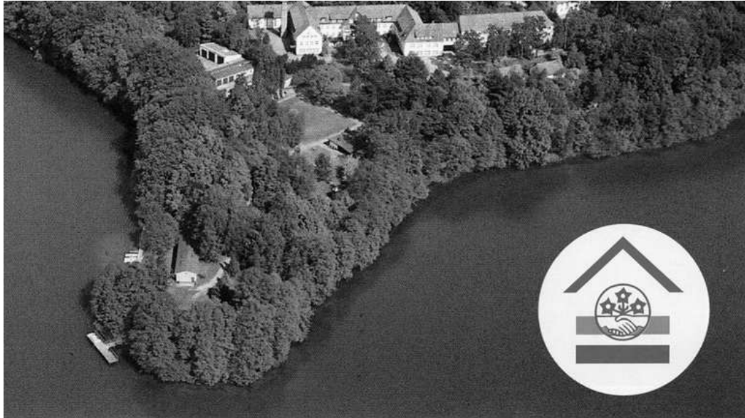
La Naturamika Domo - la kunvenejo - apud lago Üdersee