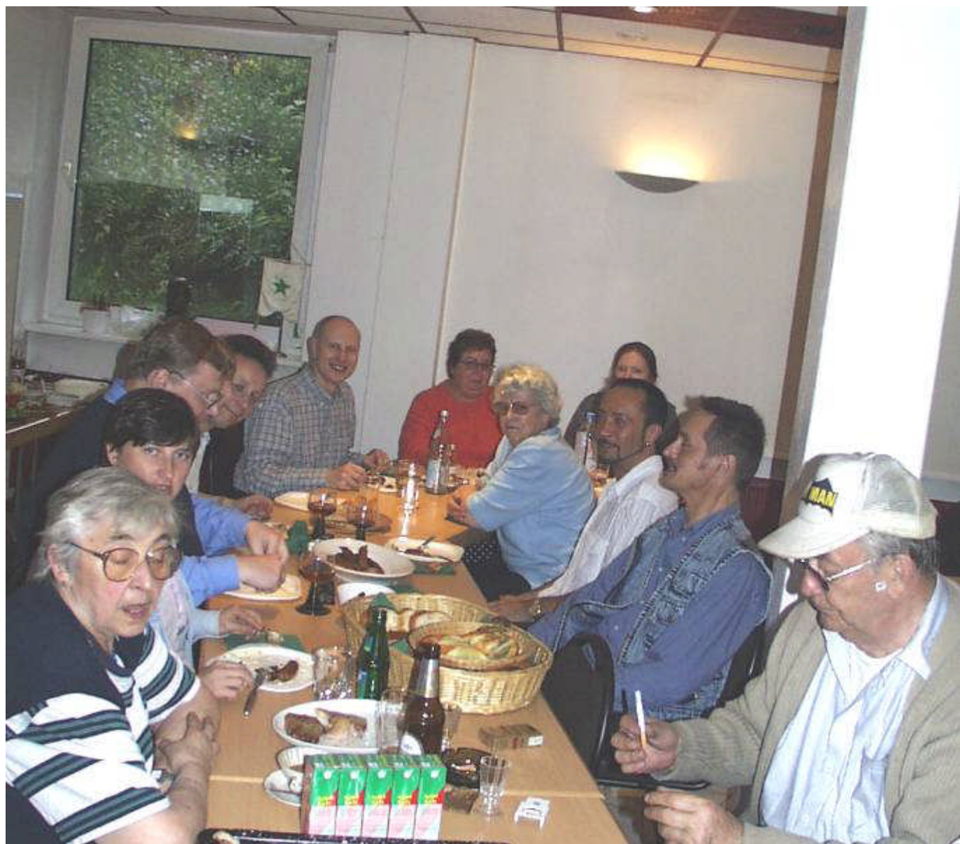
Somera festo en la Hamburga klubejo 19-07-2001 - pro pluvo ne en la ghardeno.